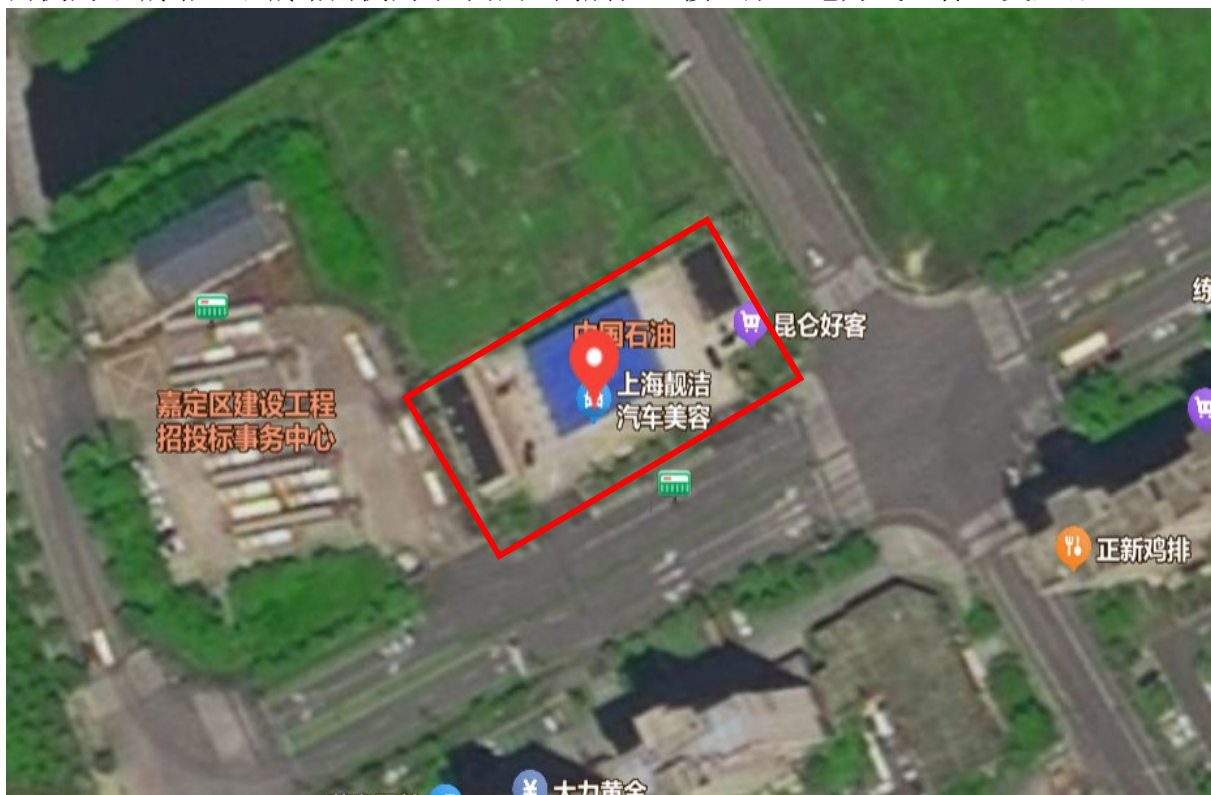
加油站地理位置图

上海创智油品有限公司，位于上海市嘉定区平城路 2988 号 1 幢 101 室，站址自然地形较平坦。东侧为慈竹路；北侧为空地、河道；西侧为平城路客运站，南侧为平城路，平城路南侧为永泰嘉苑高层住宅楼、架空电力线、杆上变压器。