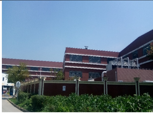
南侧中船重工第 704 研究所厂房