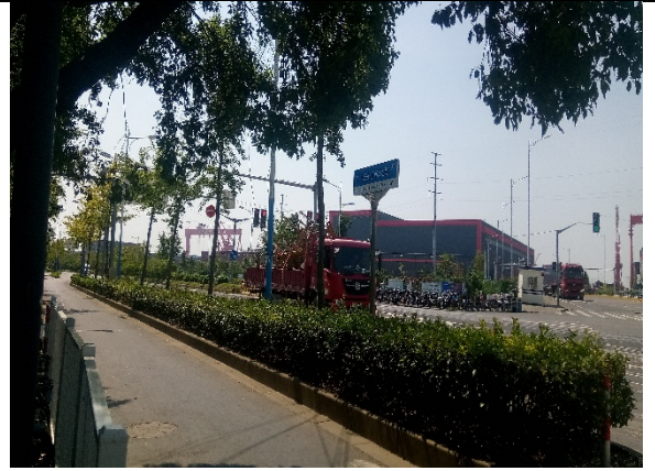
西侧长兴江南大道