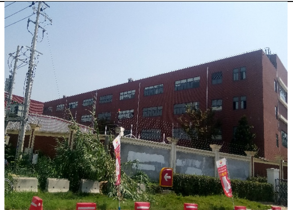
东侧中船重工第 704 研究所厂房