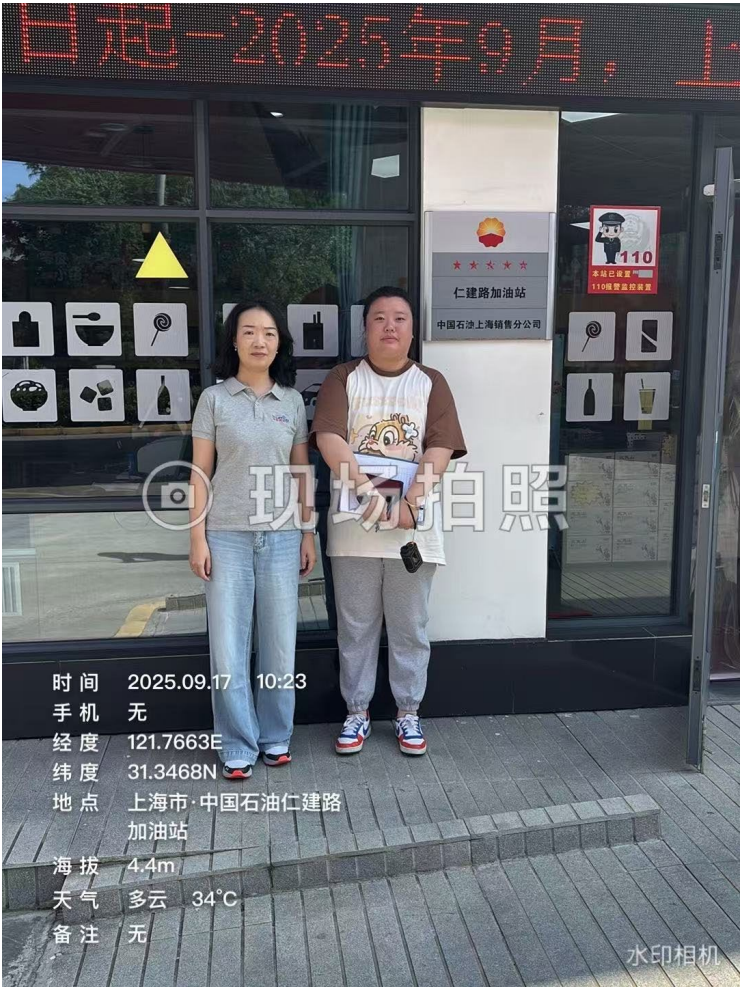
项目组人员第一次去现场照片：