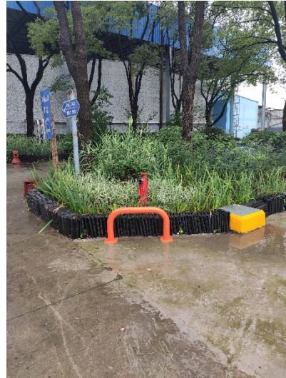
图4 消火栓防撞装置