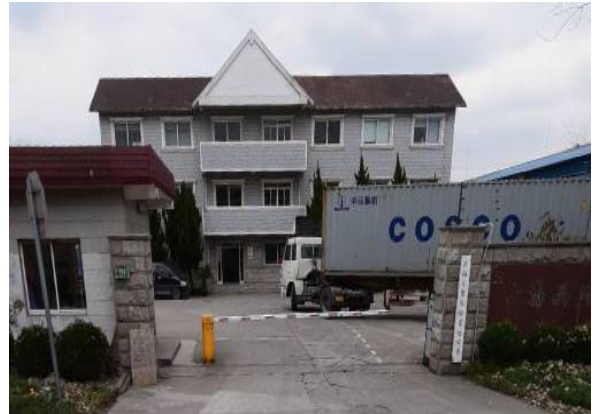
西侧: 上海天聚运输有限公司