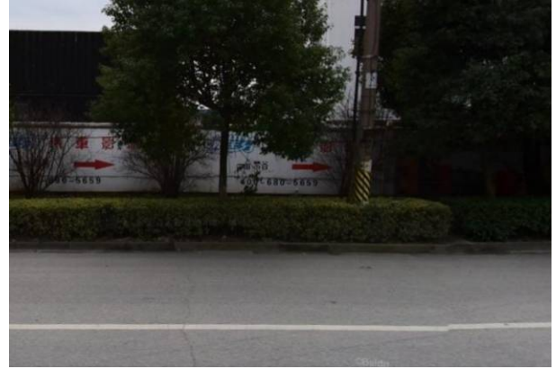
南侧: 梦谷南创意有限公司