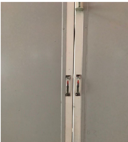
图7 仓库西侧的门外部推拉把手