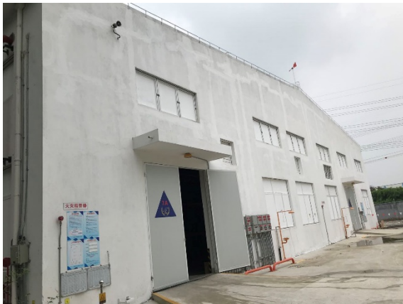
图 1 仓库上测窗户涂料油漆进行防晒