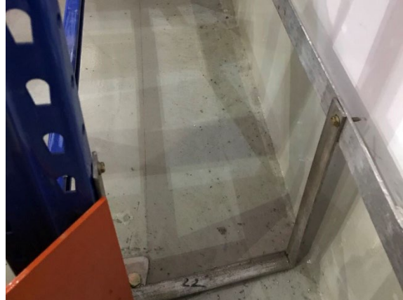
图 2 货架跨接线